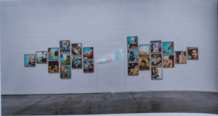
A Feeling in Perspective installation view (2016) at Isabelle Van Den Eynde Gallery in Dubai